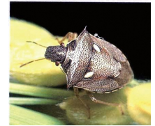
トゲシロホシカメムシ