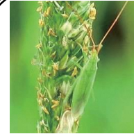
アカヒゲホトリカスミカメ