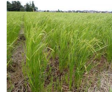
秋の高温によりひこばえが生育したほ場が多く、湧きの発生が懸念