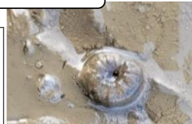
キリウジガガンボの幼虫

JAみな穂では、ルーチンシードFS(いもち病)、ヨーバルシードFS(イネドロオイムシ、イネミズゾウムシ、キリウジガガンボ、ニカメイチュウ)を処理したカルパーコーティング種子を供給していますので、初期害虫や葉いもち病の防除は必要ありません。